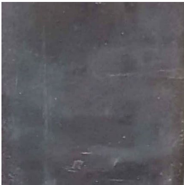
Blanker Industriestahl real steel: